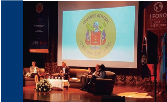
▲ Foto: I Foro Internacional de Justicia y Memoria, celebrado el 8 de junio del 2017. Teatro Patria.

contribuido a la persistencia del conflicto, y los efectos e impactos más notorios sobre la población. Esta iniciativa académica pretendió reunir las diversas visiones e interpretaciones que intelectuales, sectores políticos, económicos y sociales han elaborado sobre este proceso de violencia.