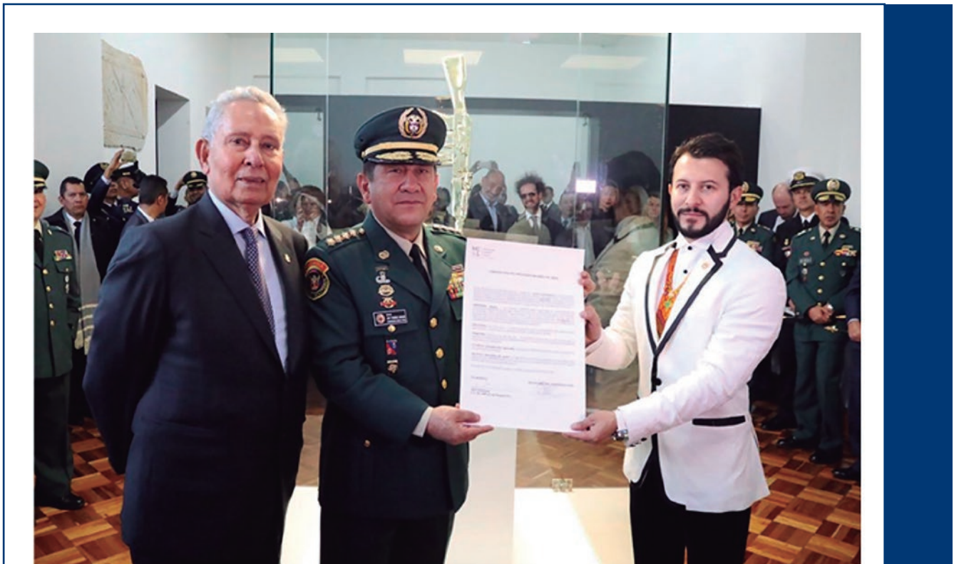
Foto: Entrega de la obra de arte “Metamorfosis”, del artista colombiano Alex Sastoque, al Museo Militar.

estratégicas, de las cuales una estaba enfocada a la creación de la Jefatura de Memoria Histórica y Contexto Conjunta de las Fuerzas Militares, que tuvo como objetivo emitir directrices e instrucciones para investigar, documentar, articular