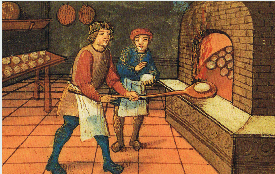
Aprendiz de panadero en la edad media 1 .