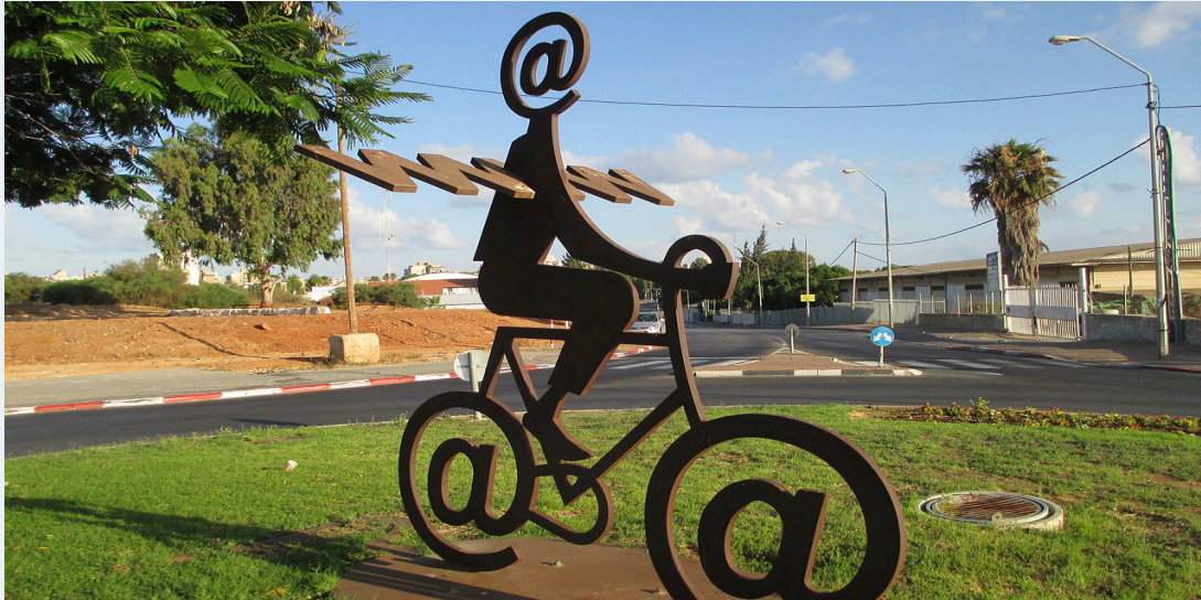
Día del internet 7 .

Finalmente, y en medio de una espiral de Innovación+Desarrollo , llega Internet y nace la sociedad de la información y la era del conocimiento. La comunicación alcanza niveles jamás pensados y el diseño además del marketing cobran mayor protagonismo, ahora el mayor coste en la producción se lo lleva el I+D, tras lo cual la producción del bien o servicio tiene costes mas modestos.