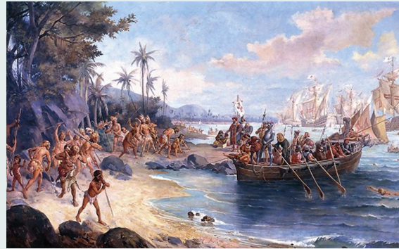
Desembarque de Pedro Álvarez Cabral en Porto en 1500 2 .