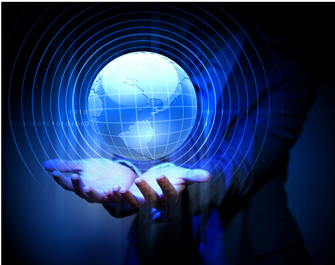
Figura1.1 Introducción a la administración I.