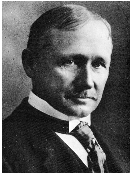
Figura 1.6 Frederick W. Taylor. Promotor de la organización científica del trabajo. 2

Se puede decir que la administración se apoya en principios que pertenecen a la ciencia, que hace uso de la creatividad y la destreza eventos que provienen del arte y que a través de la aplicación de cientos de procedimientos, que corresponden a la técnica, la administración busca lograr siempre, de manera eficiente, los objetivos trazados.