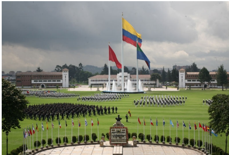
Figura 1.9 Influencia de la organización militar en la administración. 6

Según James D Mooneya , la Iglesia tiene una organización jerárquica tan simple y eficiente que su enorme organización mundial puede operar satisfactoriamente bajo el mando de una sola cabeza ejecutiva: el Papa, cuya autoridad coordinadora, según la Iglesia Católica, le fue delegada de forma mediata por una autoridad divina superior. El tipo de organización y su estructura han servido de modelo a otras organizaciones que han compartido sus estilos, experiencias, principios y normas.