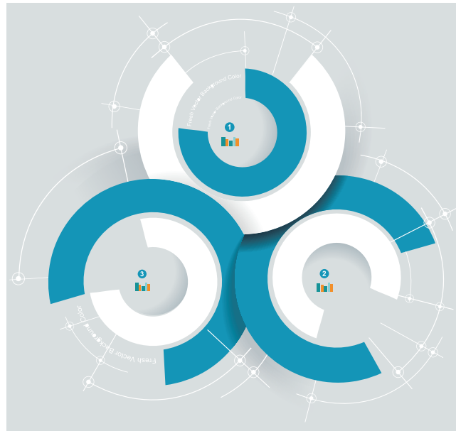
Figura1. 3 La administración comprende la coordinación de hombres, actividades y recursos materiales para la consecución de ciertos objetivos.

Las definiciones más representativas plantean que la administración es un proceso de planificación, organización, dirección y control de actividades. Algunas incrementan el número de procesos para incluir los recursos y la motivación.