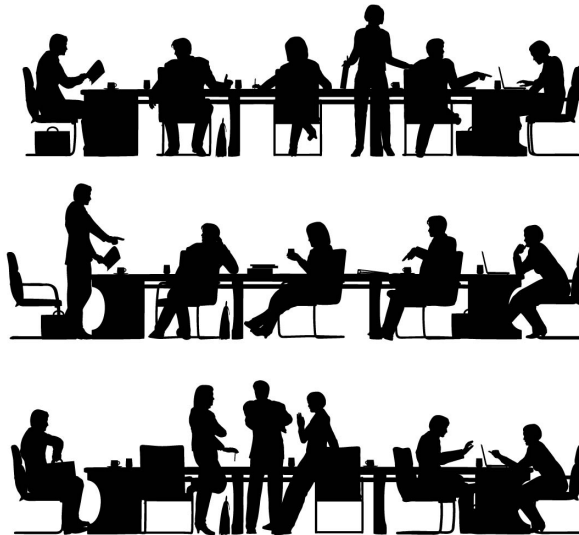
Figura 1.4 El elemento fundamental de la administración está constituido por la actividad humana.

Entonces, el elemento fundamental de la administración está constituido por la actividad humana: hombres que trabajan con otros hombres para lograr objetivos y metas comunes. De nada serviría la suficiencia del talento humano, los avances tecnológicos y el desarrollo de conocimientos e investigaciones, si la calidad de la administración aplicada a las organizaciones no es efectiva. Corresponde, en consecuencia, a la administración, como centro de gravedad en las organizaciones, un papel protagónico en la dinámica del mundo actual y en el desarrollo y crecimiento económico de las naciones.