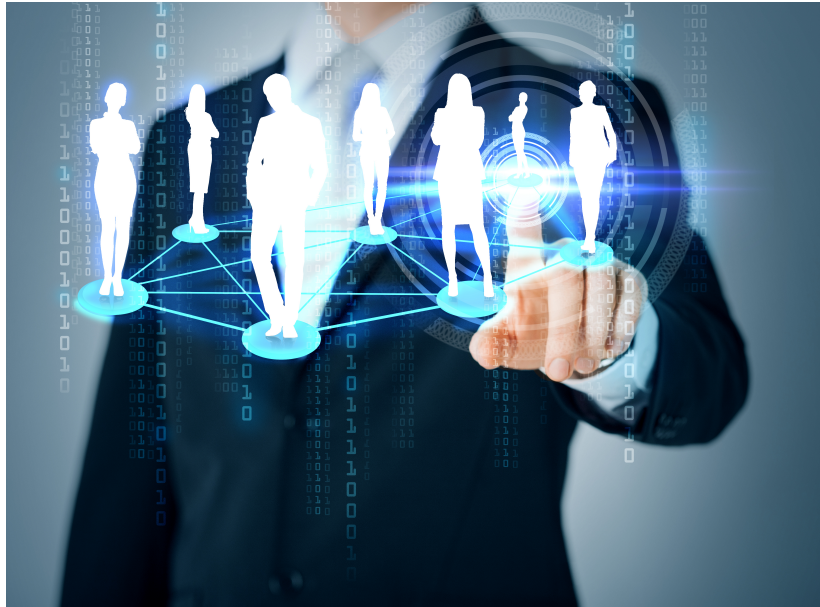
Figura1.2 Algunas definiciones de administración.

La administración, hoy y siempre, ha sido una de las más importantes funciones en todas las sociedades, encontrándose inmersa desde los hogares, cultos religiosos, gobiernos y principalmente en las empresas económicas en general.