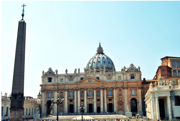
Figura 1.8 Influencia del esquema organizativo de la Iglesia Católica en la administración. 5

Desde la caída del imperio romano, la iglesia católica consolidó su importancia especialmente entre los pueblos europeos, en donde prácticamente, fue ella la que ejerció más influencia en el desenvolvimiento de la vida política, administrativa, religiosa, económica y cultural. La iglesia llegó a configurar un sistema centralizado, con jefe a la cabeza, el papa y una jerarquización desde los arzobispos hasta los párrocos y, constituyó ella, el sistema administrativo más extenso del mundo.