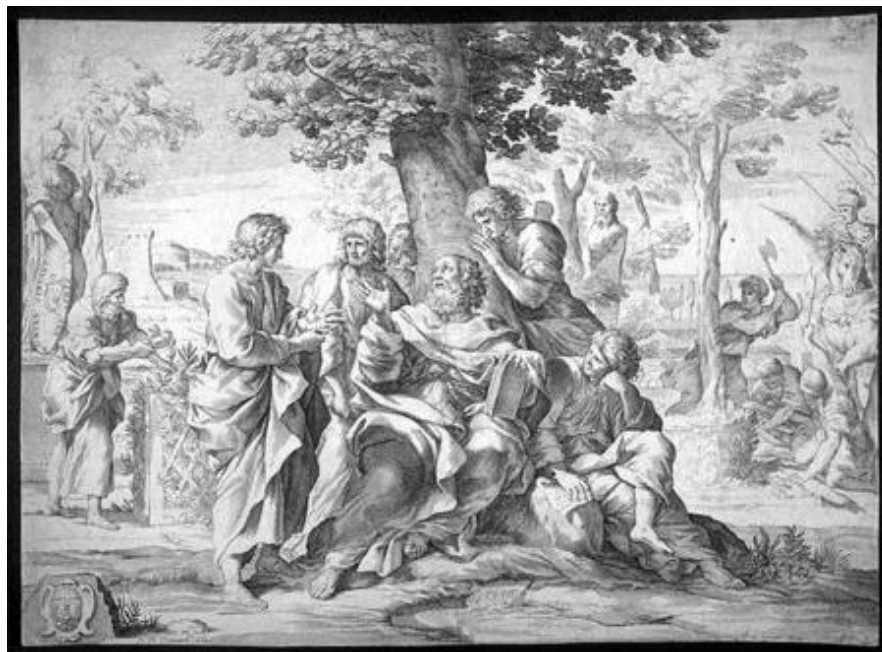
Figura 1.7 Aporte de la filosofía a la administración. 4

De otra parte, los grandes filósofos a través de su pensamiento han expuesto su punto de vista acerca de la administración. Estos son algunos aportes: