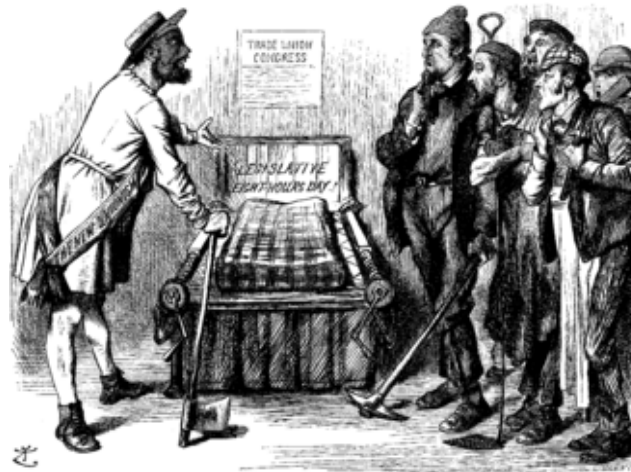
Figura 1.11 Maquinización de los oficios. Cartel de Punch que dio origen al día internacional de los trabajadores. 8

La maquinización de los oficios y manufactura generó cambios profundos en la organización del trabajo, en la sociedad laboral de los siglos XVII y XIX. La aplicación de la máquina de vapor a la producción originó una nueva concepción del trabajo, modificando completamente la estructura industrial y comercial de la época, provocando en los órdenes económico, político y social, cambios tan rápidos y profundos que en un lapso aproximado de un siglo fueron mayores que los ocurridos en el milenio anterior.